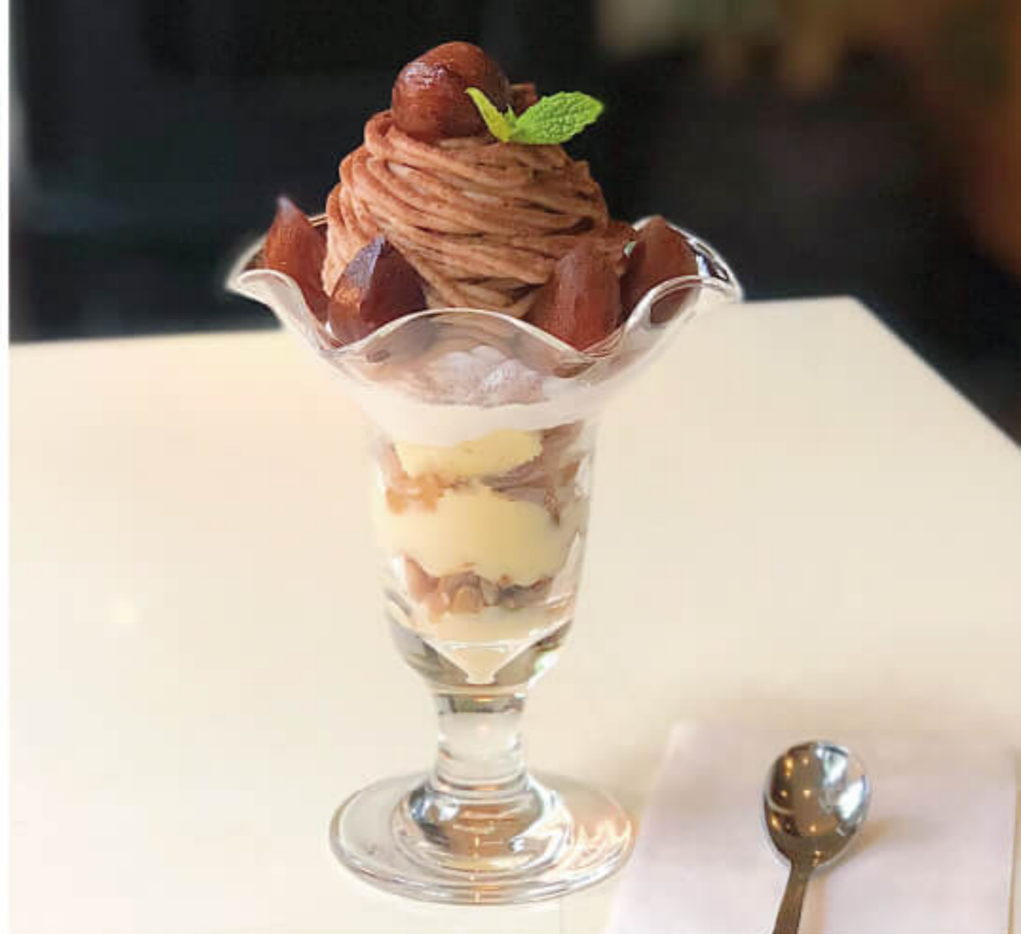
パフェモンブラン