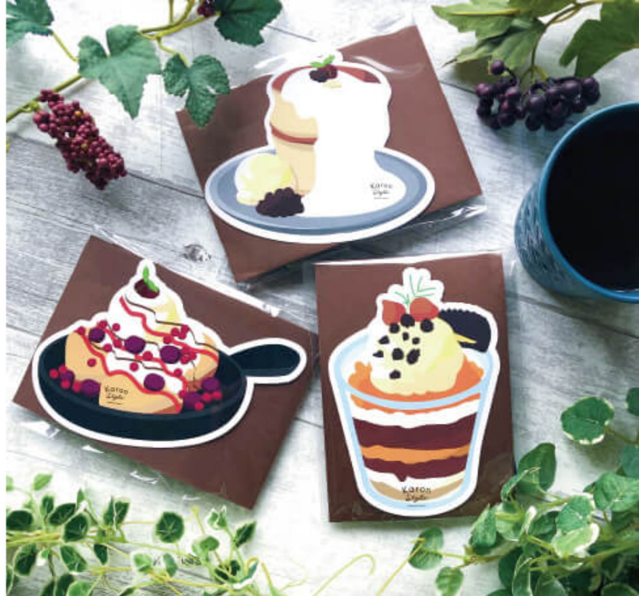
コースター付ドリップコーヒー