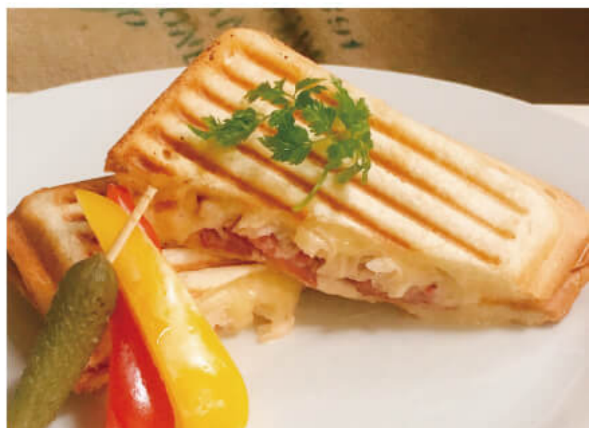
パストラミビーフのパニーニ