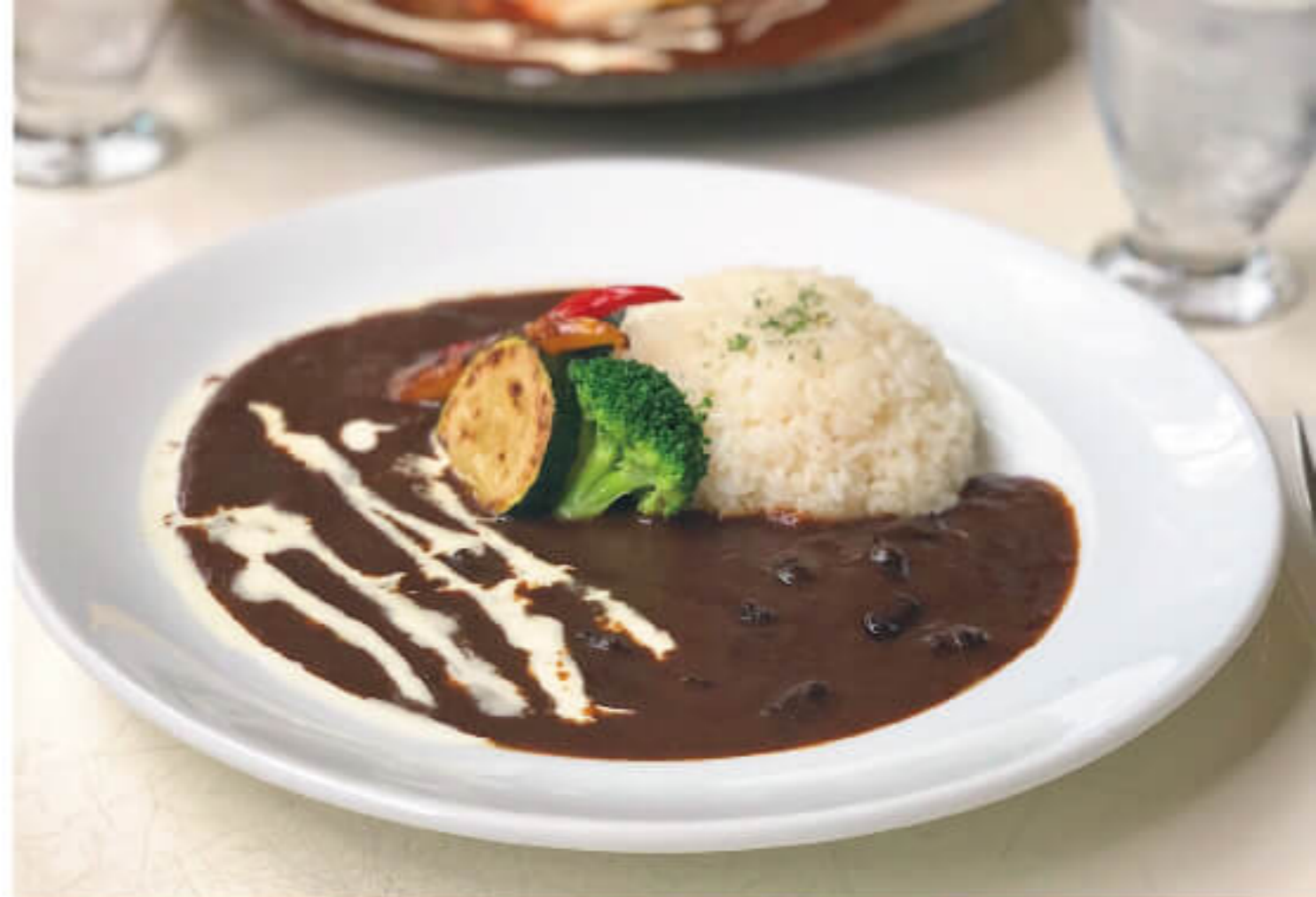
※盛り付けイメージ