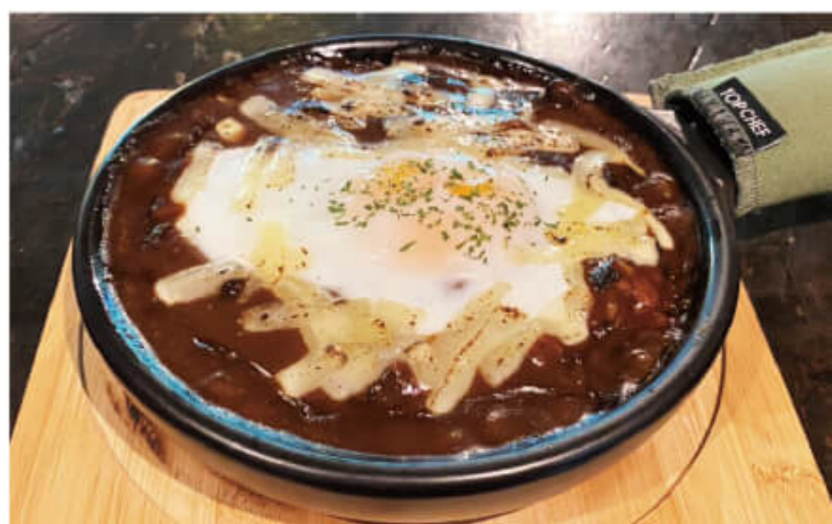
スキレットのチーズカレー