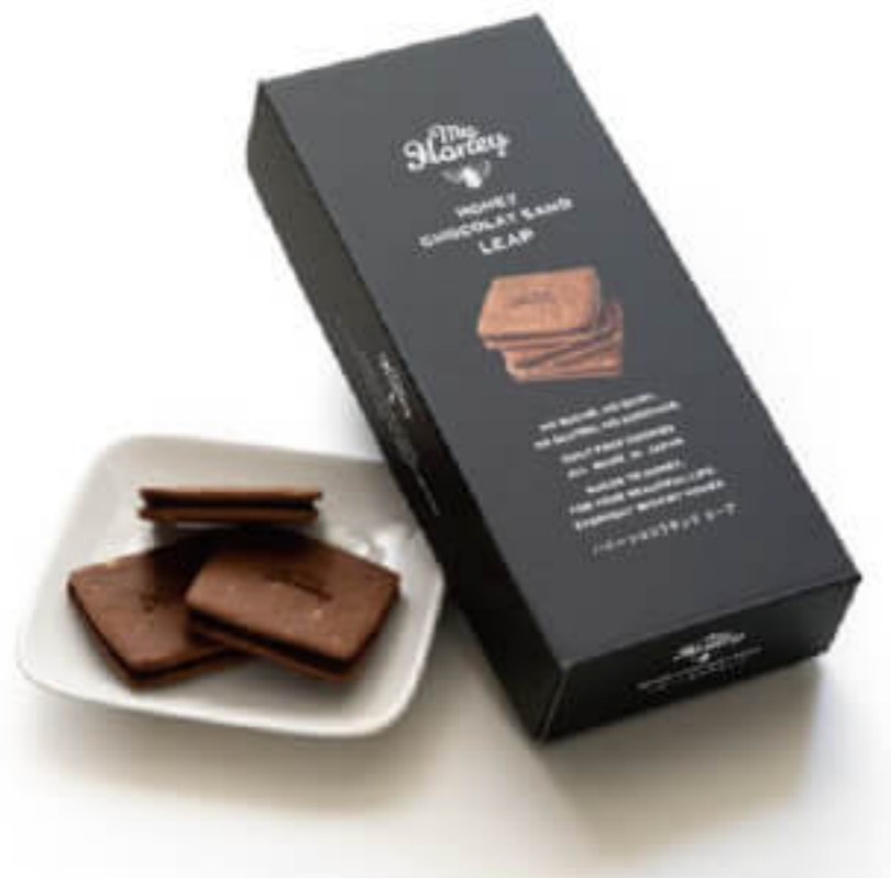
ハニーショコラサンド